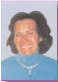
Dominique de Galard Médecin général de la santé publique. Chargée de mission à la Mission de l'adoption internationale