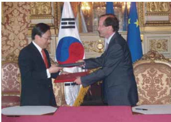
Convention franco - coréenne d'extradition, signée à Paris le 6 juin 2006.

Corée : une convention bilatérale d'extradition a été signée le 6 juin 2006 à Paris. La procédure d'approbation parlementaire a été immédiatement engagée.